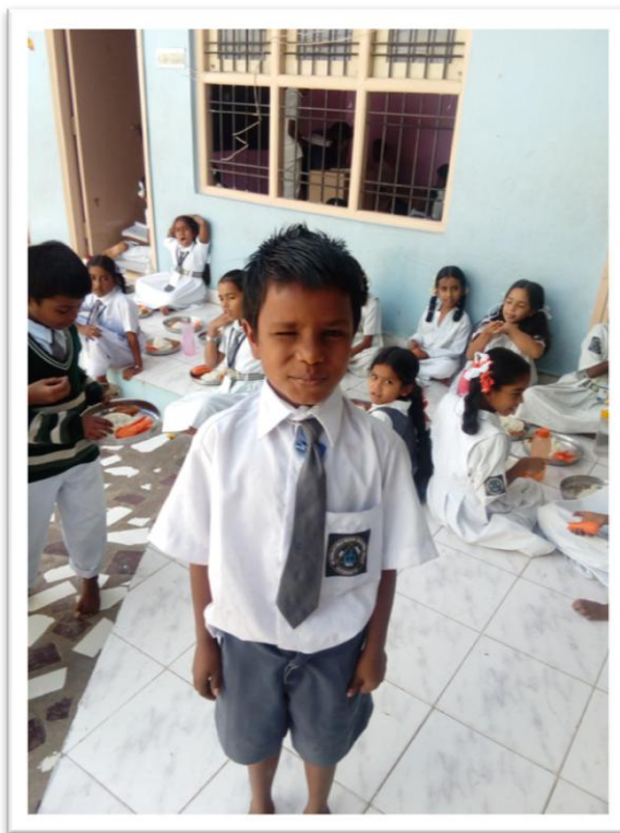
Ieder kind heeft een badge op zijn uniform

Alle kinderen hebben een badge met het embleem van de Sri Sai Vidyalaya School op hun uniform. Dit maakt de leerlingen voor anderen herkenbaar. Het embleem van de school geeft de kinderen recht op gratis vervoer van en naar school en medische verzorging.