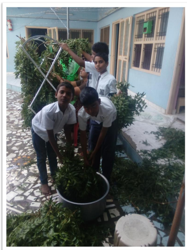
De kinderen helpen mee om kruiden te wassen en drogen

Onder de lessen van de schooltuin behoort ook het plukken, drogen en malen van kruiden uit de natuur waarvan ook heel gezonde mengsels worden gemaakt die in de warme maaltijden worden verwerkt.