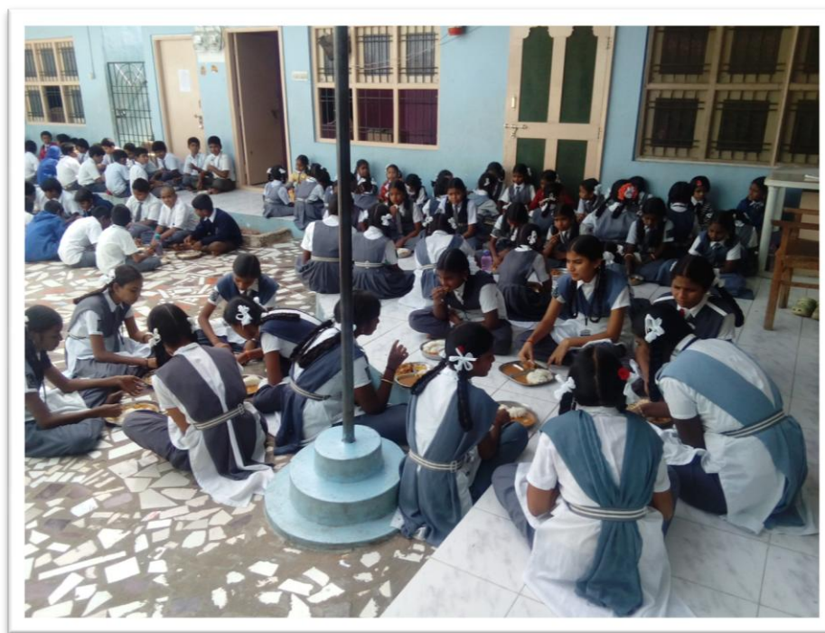
Alle leerlingen eten hun maaltijd op het schoolplein

Het Sociaal Humanitair project heeft op het moment dat dit jaarverslag gepubliceerd is geen nieuwe doelen vastgesteld.