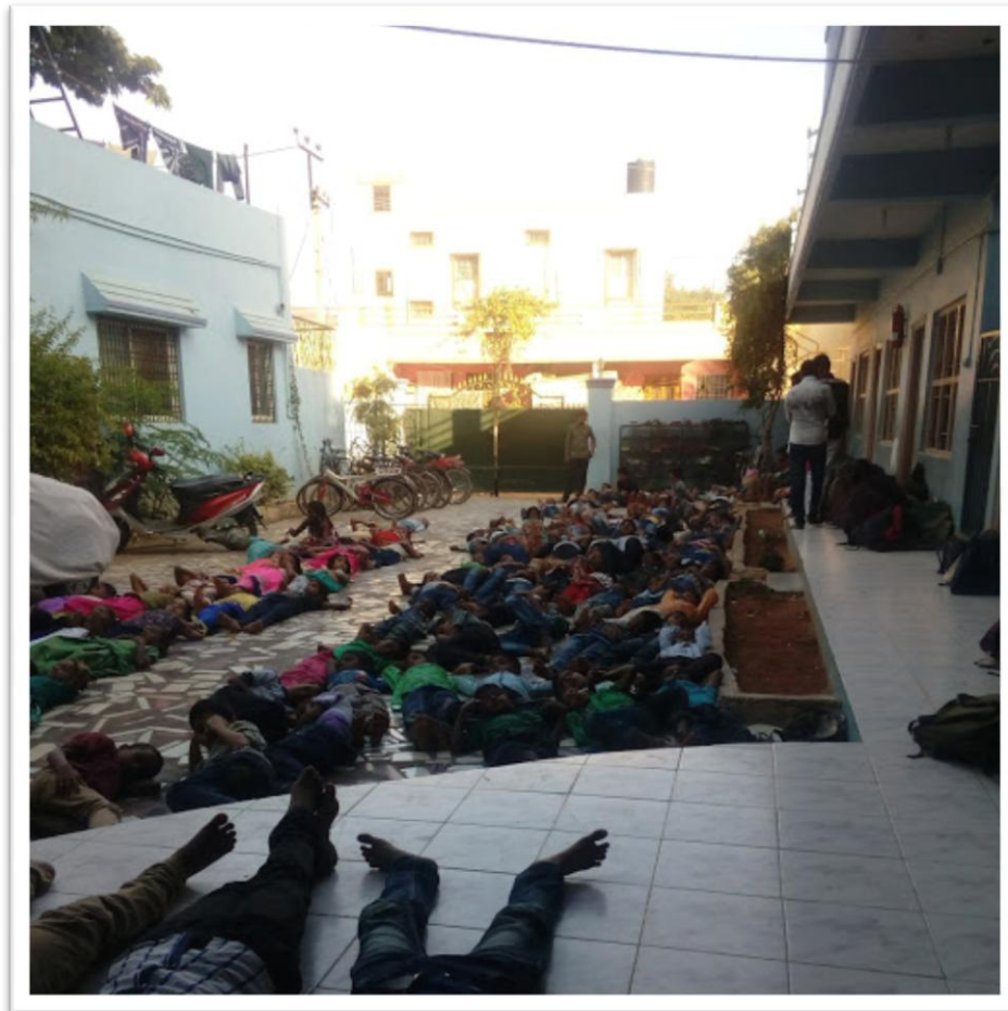
Lekker ontspannen op het schoolplein

Vooralsnog neemt de SSF de totale financiering voor haar rekening, maar het is uiteindelijk de bedoeling dat de school zonder donaties kan voortbestaan. Daarvoor is nog een lange weg te gaan, maar het begin is gemaakt.